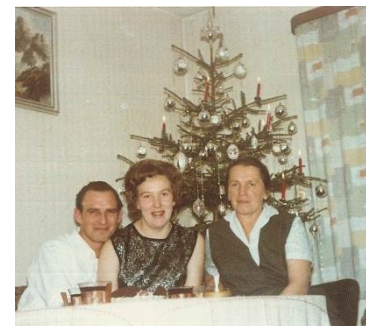
Christbaum 1965

Weihnachten: Der Christbaum war eine einfache Fichte mit roten Wachskerzen, bunten Kugeln und Lametta. Zum Essen gab es traditionell Weißwürste. Es war üblich, dass die Puppenstube, die ich bekommen habe, nach Weihnachten wieder weggeräumt wurde. Ich bekam im nächsten Jahr wieder die gleiche Puppenstube. Um Mitternacht wurde die Mette besucht, die sehr feierlich war.