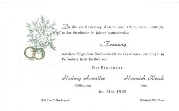
Hochzeit und Hochzeitseinladung 1965

Bauernhochzeiten wurden am Montag gefeiert.