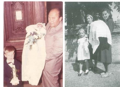
Taufe 1953 und Taufe 1970

Taufen: Getauft wurde wenige Tage nach der Geburt. Bei der Taufe waren nur die Eltern, evtl. Großeltern und Paten dabei. Das Kind wurde in einem Stechkissen zur Taufe gebracht, mit dem Hochzeitsschleier bedeckt. Ein Kind (Geschwister) durfte die Taufkerze tragen. Gefeierte wurde höchstens mit Kaffee zuhause.